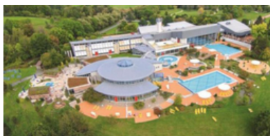
Natur-Therme (35 min Auto)